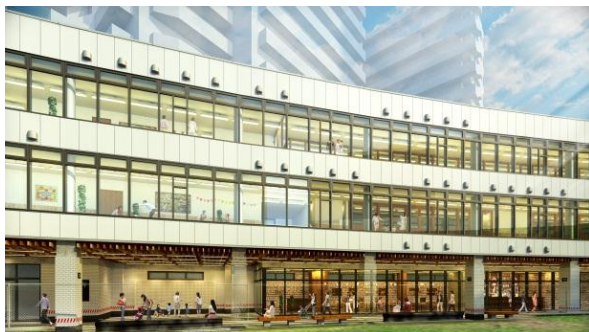
▲認定こども園が開園するA棟外観イメージ