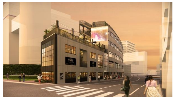
▲B棟外観イメージ(代官山駅側)